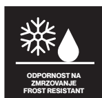
ODPORNOST NA ZMRZOVANJE FROST RESISTANT