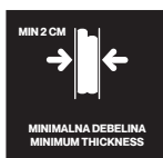
MIN 2 CM MINIMALNA DEBELINA MINIMUM THICKNESS