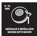
5-10 MIN MEŠANJE Z MEŠALCEM MIXING WITH MIXER