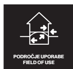
PODROČJE UPORABE FIELD OF USE