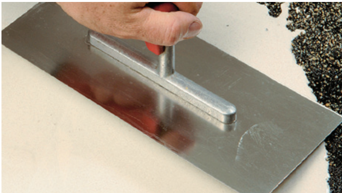
Samorazlivna talna izravnalna masa