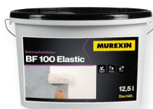
BF 100 ELASTIC