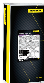
TAL M FLOW 50