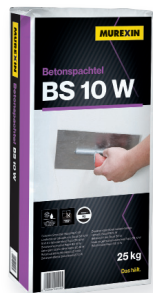
BS 10 W