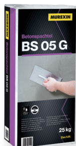
BS 05 G

Betonske kozmetične izravnalne mase BS 05 G (siva) in BS 10 W (bela) sta enokomponentni malte za lokalna popravila ali popravila betona na večji površini. Posebej primerni kot barvno ujemajoča se kozmetična popravilna malta, za manjše lokalne betonske površinske poškodbe, kot so poškodovani vogali, odlomljeni robovi, pore, luknje kakor tudi za površinsko izravnavo neravnin. Masa je po obdelavi paroprepustna in odporna na zmrzal. Z mešanjem BS 05 G in BS 10 W lahko dosežemo različne sive nianse, ki se bolje ujemajo z betonskimi podlagami. Oba BS izdelka se nanaša z zidarsko lopatico ali gladilko na predhodno dobro navlaženo betonsko podlago (na zahtevnejših in vpojnih podlagah predlagamo uporabo veznega premaza KEMALATEX , redčen z vodo v razmerju 1:1). Takoj ko malta začne vezati, se lahko obdela z leseno ali plastično gladilko, stiroporjem ali gobico.