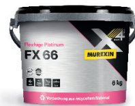
FX 66 PLATINUM FUGIRNA MASA