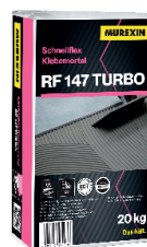
RF 147 TURBO