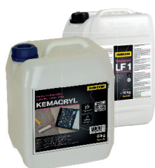
KEMACRYL / LF 1 GLOBINSKI PREDPREMAZ