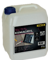
KEMACRYL GLOBINSKI PREDPREMAZ