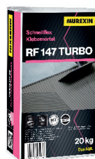
RF 147 TURBO