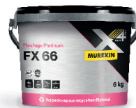
FX 66 PLATINUM FUGIRNA MASA