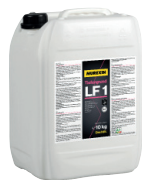
LF 1 GLOBINSKI PREDPREMAZ